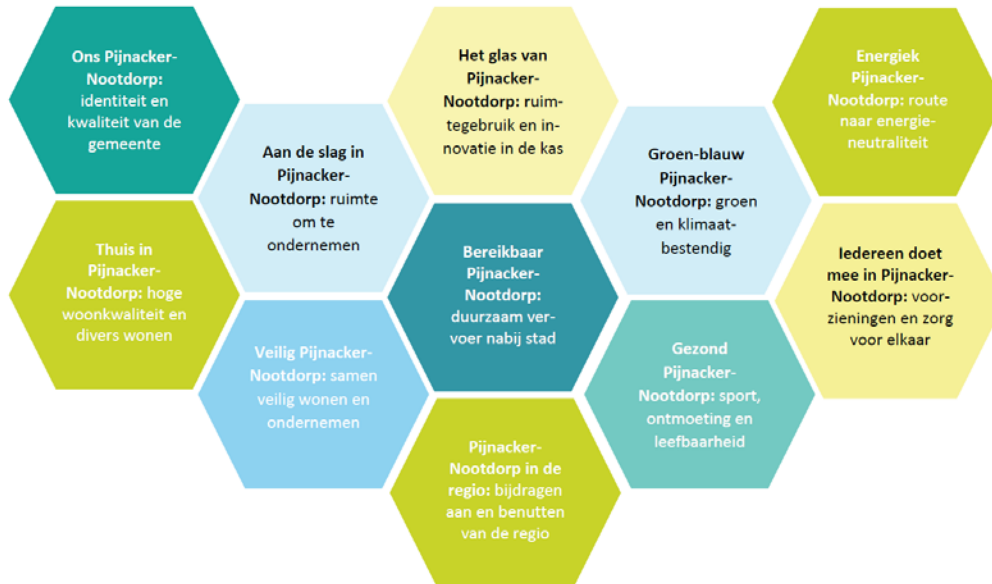
Figuur 1: Bouwstenen voor de Omgevingsvisie van de gemeente Pijnacker-Nootdorp

Naast de documenten “het Fundament” en “de Vloer” volgen er nog 4 fases in het bouwproces van de Omgevingsvisie Pijnacker-Nootdorp. Uiteindelijk ziet de planning voor het opstellen van de Omgevingsvisie er als volgt uit: