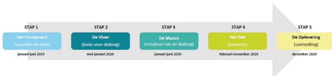
Figuur 2: Schematische weergave van het proces voor het opstellen van de Omgevingsvisie.

Figuur 2 geeft de stappen weer die genomen zijn en die nog genomen moeten worden in het proces van het opstellen van de Omgevingsvisie voor de gemeente.