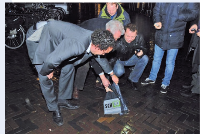
Wethouder Nico Oudhof onthult samen met de prijswinnaars bij Cultura in Nootdorp de eerste tegel.

die avond de eerste Pijnacker-Nootdorp Schoon!-logo tegel geplaatst. Met dit logo wil de gemeente de aanpak tegen zwerfafval herkenbaarder maken. De tegels met logo worden op diverse plekken in de gemeente geplaatst. Zo laten we zien dat de gemeente - samen met bewoners - werkt aan een schoon