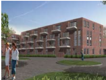
Weidevogelhof in Keijzershof