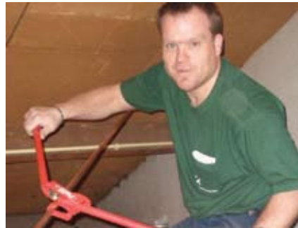
Allround vakman Onderhoudsdienst